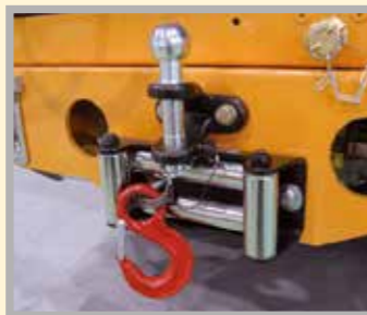
Bola de enganche con tracción máxima de 3.500 kg. Cabestrante de 50 m y 6.308 kg (longitud del cable 5,3 m) de fuerza para trabajo seguro en grandes pendientes descendentes