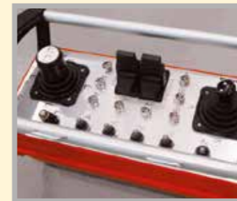
Control remoto proporcional dual (radio/cable) para un fácil manejo del equipo