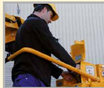
Palancas para el control manual de las orugas en caso de emergencia