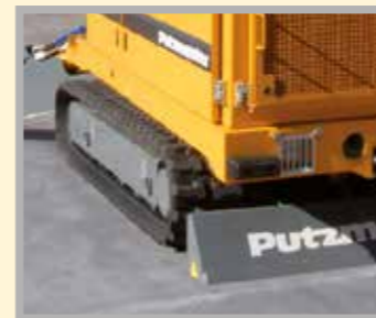
Cuchilla trasera de accionamiento hidráulico para trabajo seguro en grandes pendientes ascendentes