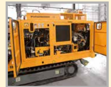
Facilidad de acceso a los puntos de servicio para el mantenimiento