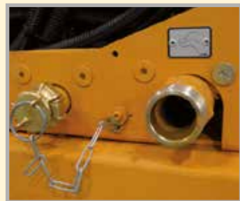
Acoplamiento rápido para las líneas de hormigón, aditivo y aire. Sin mangueras en los laterales que entorpezcan el trabajo