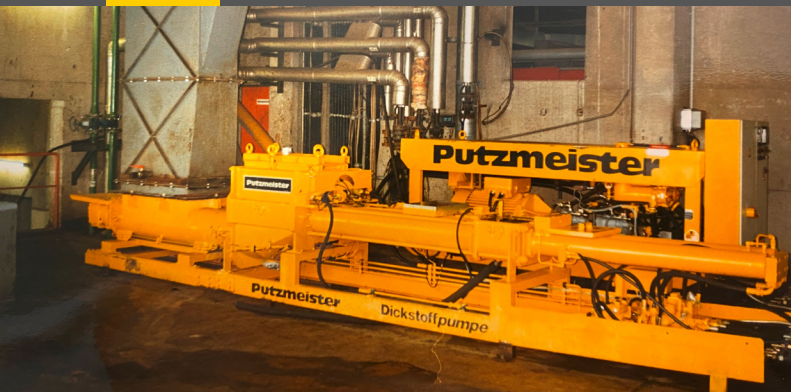
Une pompe Putzmeister pour liquide épais de 1987